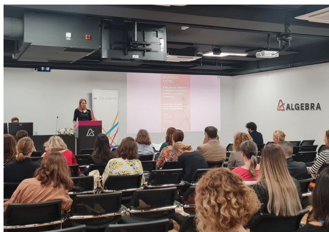
5. Dani obrazovnih znanosti

Znanstvena konferencija 5. Dani obrazovnih znanosti održana je 19. i 20. 10. 2022. godine u Zagrebu, a bila je posvećena temi „Kako poticati dobrobit u odgojno-obrazovnom okružju u izazovnim vremenima?“ Konferencija je okupila 143 sudionica/ka iz Hrvatske, Srbije, Slovenije i Kanade. U sklopu konferencije održana su tri plenarna izlaganja: prof. dr. sc. Jelena Vranješević sa Sveučilišta u Beogradu održala je izlaganje „Koje je boje sreća – što kaže pravednost?“, dr. sc. Linda Liebenberg sa Sveučilišta Dalhousie, Kanada izložila je temu „The role of schools in augmenting resilience resources for children and adolescents in times of adversity“, a dr. sc. Ana Kozina s Pedagoškog instituta u Ljubljani govorila je o temi „The Psychological Response to the COVID-19 Pandemic in Slovenia: The Role of Social and Emotional Competencies“. U sklopu konferencije održan je i simpozij u čast profesorici Vlasti Vizek Vidović pod nazivom „Razvoj učiteljskog identiteta u Hrvatskoj“. Skup je završio održavanjem okruglog stola „Otpornost i profesionalna dobrobit učitelja i nastavnika u izazovnim vremenima“.