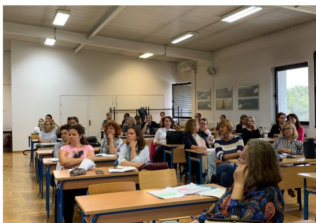
Edukacija nastavnika ŠiZ-a