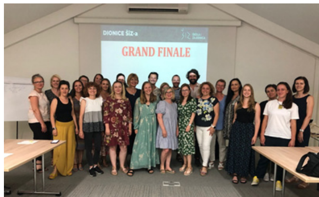
„Škola i zajednica“ - edukacije za školske djelatnike