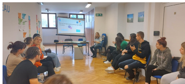
Trening za mlade u sklopu UNICEF-ovog projekta