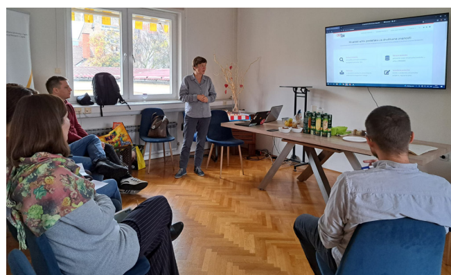
CROSSDA - Radionica o pohrani podataka