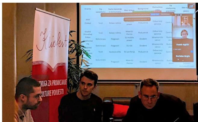
Znanstveni kolokvij „Moć politika povijesti: Povijest u javnom prostoru 2022.“