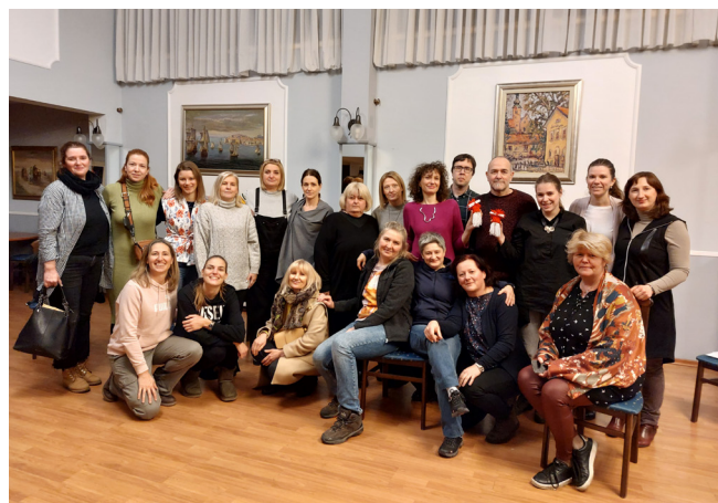
Hand in Hand - treninzi za učitelje

U okviru našeg projekta HAND in HAND, trenerski timovi iz IDIZ-a provode program profesionalnog i osobnog razvoja za stotinjak učitelja iz 9 eksperimentalnih osnovnih škola: OŠ Gračani, OŠ Središće, OŠ Prečko i OŠ Voltino iz Grada Zagreba, OŠ Milana Langa iz Bregane, OŠ Velika Mlaka iz Velike Mlake, OŠ Ljubo Babić iz Jastrebarskog, OŠ Samobor iz Samobora i OŠ Josipa Zorića iz Dugog Sela. Intenzivan praktični rad, koji se sastoji od 11 susreta s učiteljima, raspoređenih tijekom cijele školske godine 2022./2023., popraćen je i kraćim programom senzibilizacije ravnatelja i stručnih suradnika za teme socio-emocionalnih kompetencija i svijesti o različitosti.