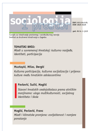
Sociologija i prostor br. 3 (225)