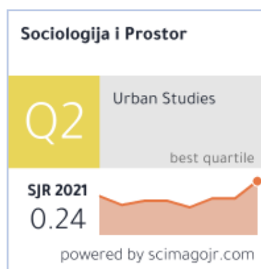
Sociologija i prostor po prvi put u Q2