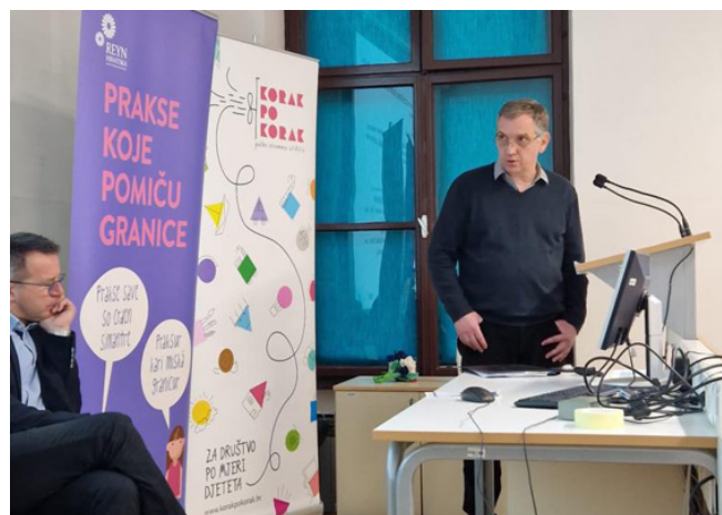
Konferencija REYN Hrvatska