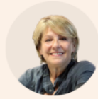
PIŠE SANJA MODRIĆ

To je težak poraz europske kulture koji mora unijeti nelagodu u svakog čovjeka koji o takvom zastranjenju promisli barem pet minuta